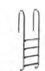
Escada interior de aço inoxidável