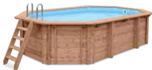
ABT-750-0005 Piscina de Madeira Blue Lagoon 5,63 x 3,52 m (A 1,24 m)