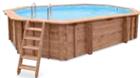
ABT-750-0002 Piscina de Madeira Sea Breeze 6,07 x 3,96 m (A 1,31 m)