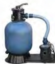
Bomba e filtro de areia