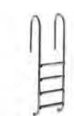
Escada interior de aço inoxidável