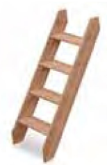
Escada exterior amovível

Todos os modelos têm incluído manual de instalação detalhado e o equipamento necessário para construir e começar, rapidamente, a usar a sua piscina.