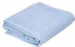
Liner da cor azul e geotêxtil (fundo e paredes)