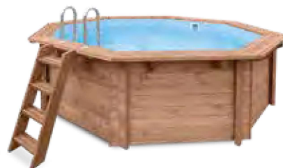
ABT-750-0001 Piscina de Madeira Tropical Sunshine 4,34 x 4,01 m (A 1,18 m)