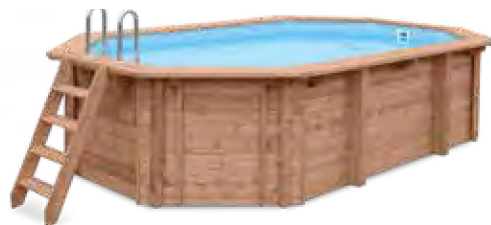
ABT-750-0005 Piscina de Madeira Blue Lagoon 5,63 x 3,52 m (A 1,24 m)