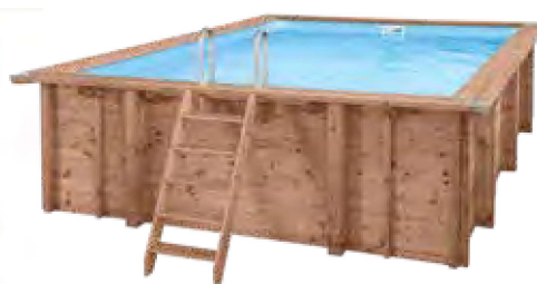
ABT-750-0003 Piscina de Madeira Summer Oasis 6,00 x 4,19 m (A 1,31 m)